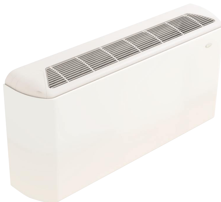
Рис. 6. Вертикальный фэн-койл MFU